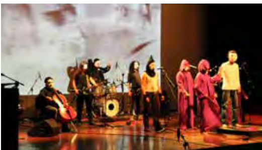
Evento artístico de cierre de la campaña NoCopio Noviembre 2015

15: espacios 23: colectivos artísticos 502: voluntarios 966: adolescentes 2.415: contertulios 234.927: audiencia