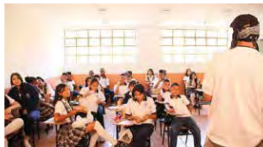
Contando para la vida, red artística con adolescentes Julio - Noviembre 2015