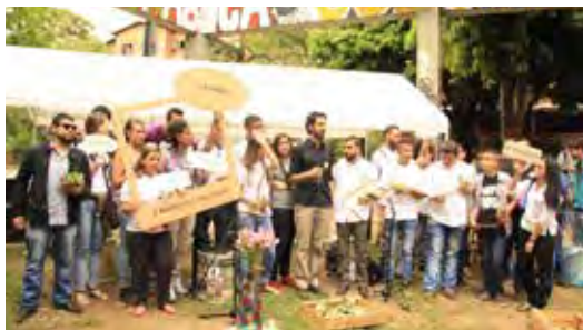
Medellín Consciente, veeduría de elecciones con adolescentes Julio- Octubre 2015

El impacto es movilizar una poderosa idea de desnaturalización del homicidio –trabajando con 23 artistas o colectivos artísticos– y generar opinión sobre la autonomía ciudadana en el ejercicio electoral del año pasado. En el 2015 finalizamos un proceso investigativo sobre riesgo de homicidios para jóvenes y adolescentes en Medellín, lo que implicó la formación de la mesa de política estatal en seguridad para Medellín y el diálogo durante el proceso y resultados con la Alcaldía de Medellín y la Policía Nacional. Llevamos a cabo medición sobre el cambio en hábitos de pensamiento y esperamos que durante el 2016 esto pueda cambiar la agenda periodística, irrigar políticas y decisiones a las que les podamos hacer seguimiento en su transformación del fenómeno de violencia.