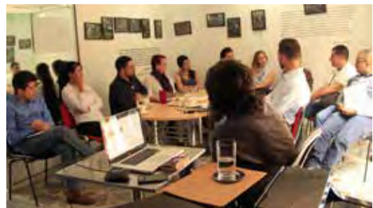
Presentación resultados de investigación Descontando en Medellín Diciembre 2015

Siendo lo más importante para nosotros la investigación, el oficio implicó 43 entrevistas, 13 grupos focales, transcripción de 40 entrevistas y 13 mesas, análisis (en algunos casos minería de datos) de 10 bases de datos; revisión de un año de prensa y el desarrollo de un software para búsqueda de información en internet.