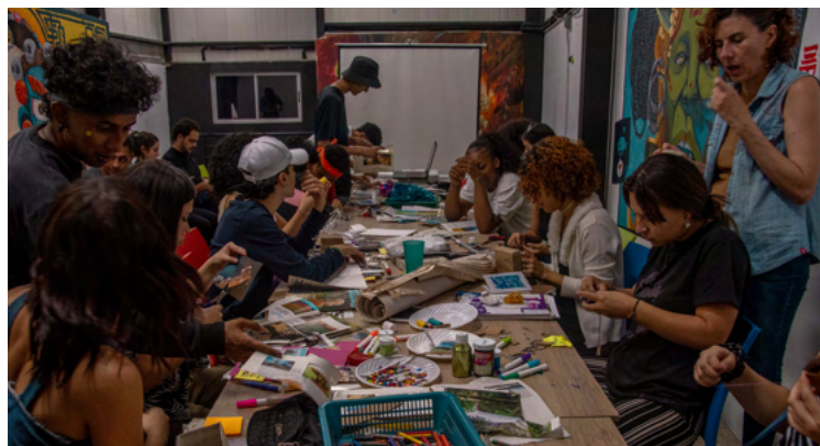
Raíz – Encarrete – 337 Jóvenes y adolescentes

En el año 2023, se realizó la apertura de nuestra cuarta casa cultural nombrada como Esquina Morada, ubicada en el municipio de Apartadó, donde los intereses de los y las jóvenes y adolescentes están girando en torno a las disidencias sexuales y de género, inclusión racial, expresadas por medio de la danza y el arte.