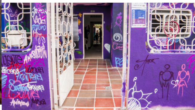
Frontera Morada – 98 Jóvenes y adolescentes