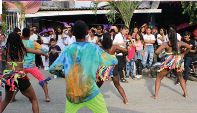
Esquina Morada – 75 Jóvenes y adolescentes

Énfasis en egresados SRPA, disidencias de género, migrantes, etnia.